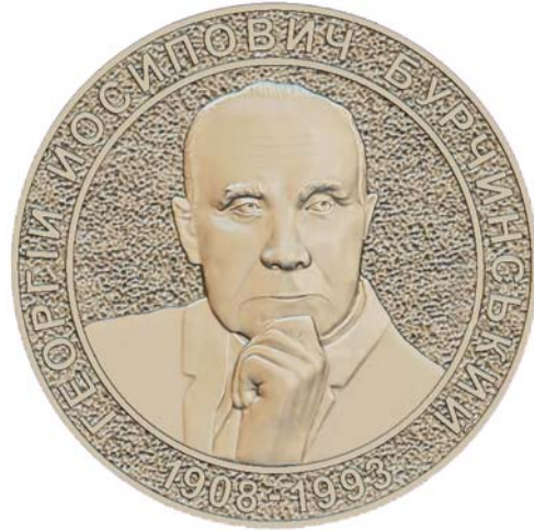
Медаль-нагорода Української гастроентерологічної асоціації за особливий особистий внесок у розвиток української гастроентерології